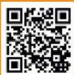
Une prise de contact avec la rédaction est requise pour toute reproduction même partielle de ce numéro.